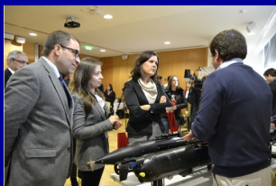
Visita da Exma. Sra. Ministra da Agricultura e do Mar à UPTEC

Neste espaço pretende-se dar a conhecer as atividades que a Oceano XXI organizou e/ou participou no último mês, bem como outras atividades relevantes que tenham ocorrido. Alguma informação mais detalhada que pretenda obter sobre qualquer atividade, por favor, contacte-nos!