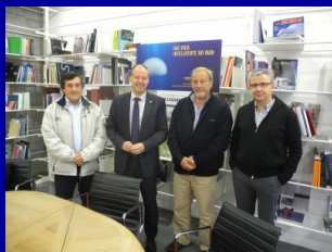
Visita do OCEANUS ao CAMPUS DO MAR (Vigo)